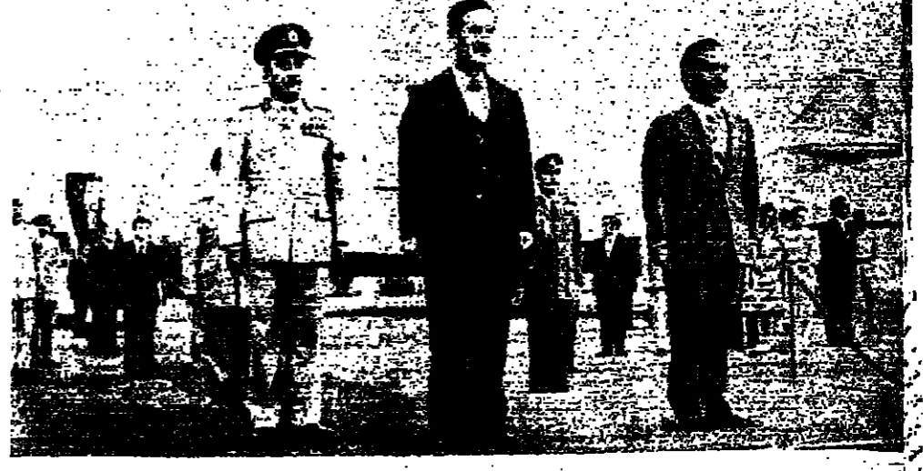
الرئيس الاسد والملك حسين في المطار قبل عودة الرئيس السوري الى دمشق أمس الأول

تلت محادثات في دمشق أمس، ان البيان المشترك من محادثات الرئيس حافظ الاسد والملك حسين، فتح انفاقا للتشويق جديد بين سوريا والاردن للعمل الموحد بين الجبهة الشرقية على الجبهة الشرقية التي تضم سوريا والاردن والقوات، وهو امر على درجة بالغة من الاهمية في الظروف الراهنة.